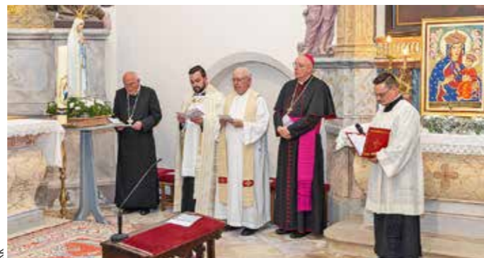
Andacht mit Bischof und Abt und Heimatpfarrer.

Als Weihspender war Weihbischof Hansjörg Hofer von Salzburg gekommen, der gemeinsam mit rund 30 Priestern und Diakonen – darunter auch dem em. Erzbischof Kothgasser – und einer großen Zahl von Gläubigen den Gottesdienst feierte.