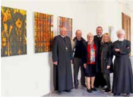
Das Tryptichon bei der Übergabe.