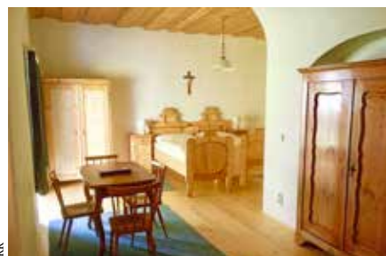
Neuer Wohnkomfort in historischem Umfeld.